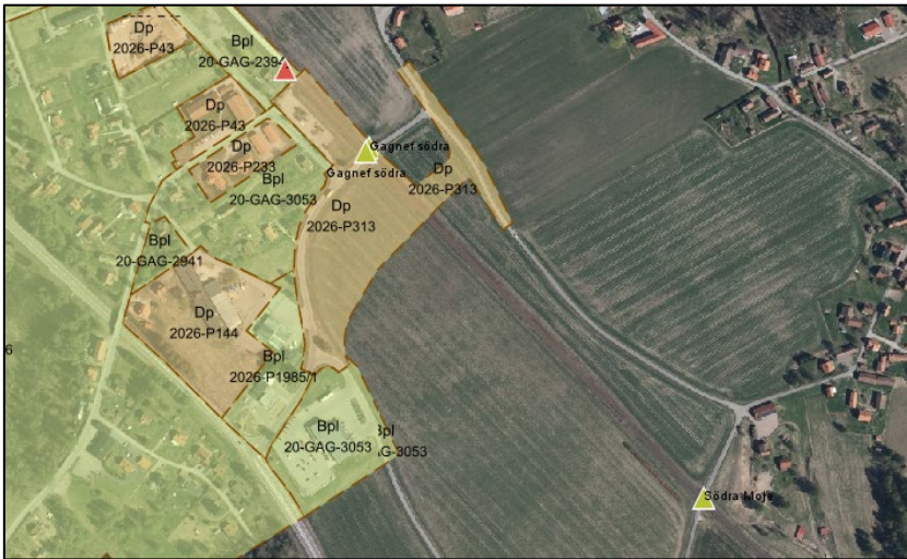
Figur 1: Överblickskarta vilket visar utbredningsområdet för detaljplan 2026-P313 samt plankorsningarna Gagnef södra samt Södra Mojes lägen.

För att uppnå syfte och mål med åtgärden så medför det att förändringar i närmiljön är nödvändiga. Alla nödvändiga åtgärder bidrar tillsammans till en förbättrad trafiksäkerhet och tillgänglighet i Gagnef.